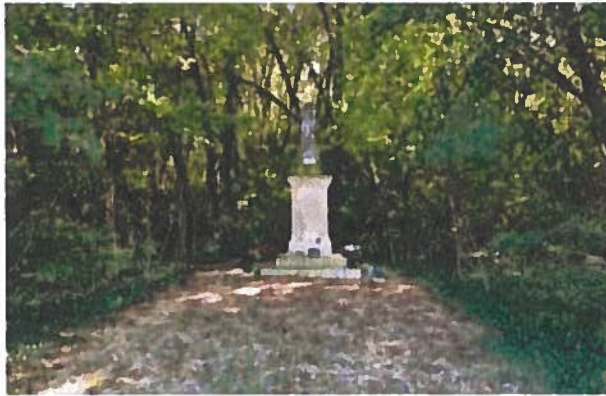
Notre Dame des champs