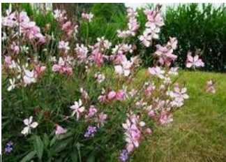
Vivaces : gaura