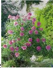
Arbustes : ciste