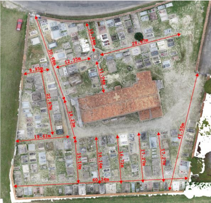
Une petite idée