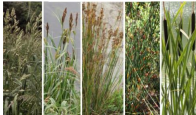
Herbacées : graminées