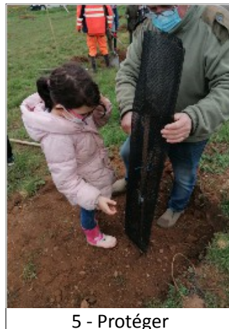
5 - Protéger