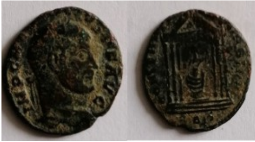
Nummus Empereur Maxence 308-310 ap. JC Collection Dominique Cirey

La commune ne compte que très peu de traces de l'ère gallo-romaine, contrairement à certaines de ses voisines. Les vestiges d'une villa gallo-romaine avaient bien été mis à jour à la fin du 19 ème siècle, à Bellicout, mais il n'en subsiste rien et nous ne savons pas de quel siècle elle datait, ni même si des artefacts (objets façonnés par les humains) ont été trouvés sur le site. Des objets de la même époque avaient été exhumés à la Touche (Ligné).