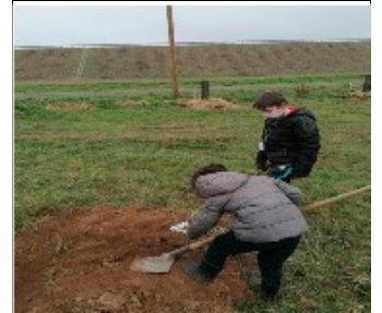
2 - Creuser