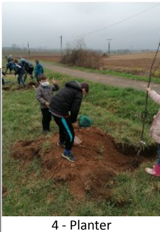
4 - Planter

Le correspondant de la Charente Libre est venu prendre des informations pour rédiger un article paru dans le quotidien local.