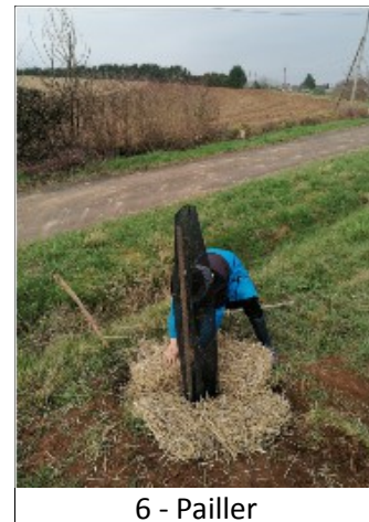
6 - Pailler

L'après midi, une quinzaine d'habitants de Charmé s'est retrouvée à 14h devant le stade pour planter les haies.