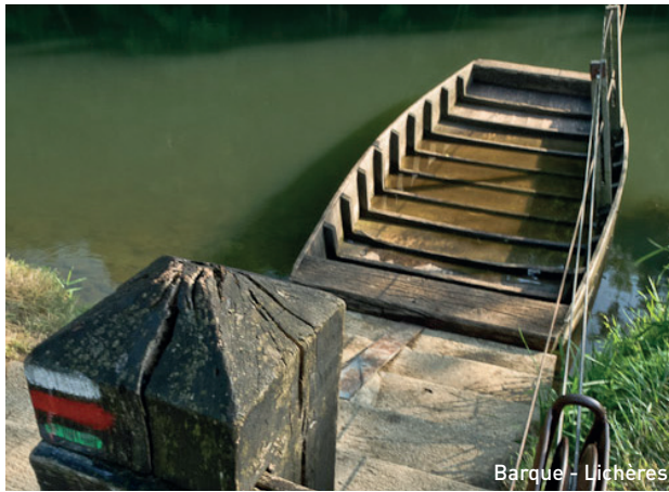
Barque - Lichères

1 Incontournable, l'église classée Saint-Denis située au milieu des champs. Achevée par les bénédictins de Charroux, elle est l'un des plus célèbres édifices romans de la Charente. Levez la tête afin d'admirer les modillons extérieurs et baissez-la en entrant afin de remarquer le pavage en cœur de demoiselle