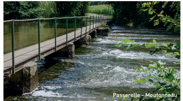
Passerelle - Moutonneau

Très agréable chemin boisé qui vous conduit vers les plateaux de Lichères afin d'admirer la superbe vue de l'église Saint-Denis au milieu des champs.