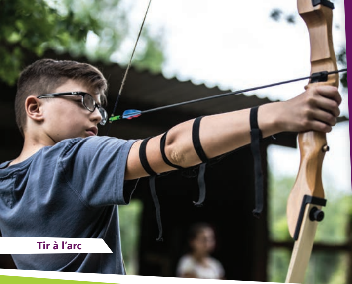
Tir à l'arc