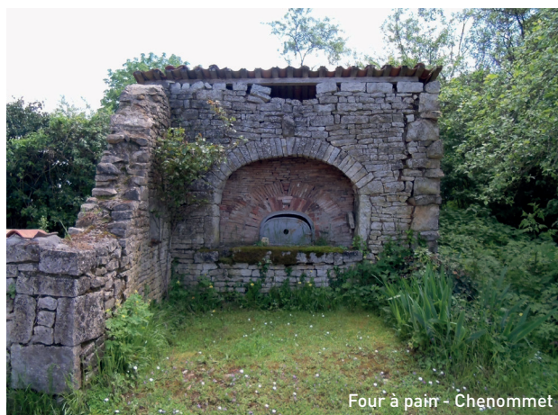
Four à pain - Chenommet

2 Vous poursuivez en surplomb de la Charente et apercevez le Moulin du Geai (privé).