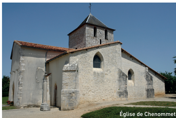
Église de Chenommet

3 Au lieu-dit «Bellevue», très beau panorama sur la vallée de la Charente.